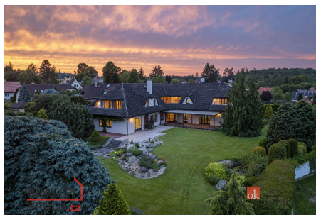
Rodinný dům, Kamenice