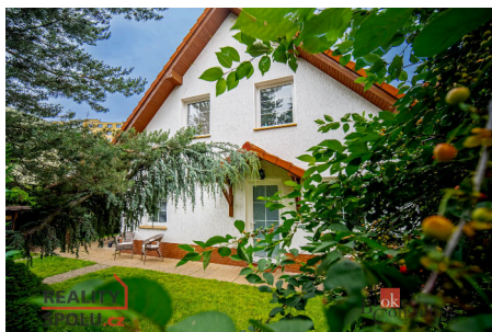
Rodinný dům, Praha