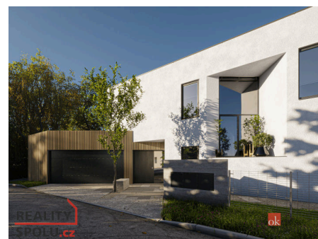
Rodinný dům, Praha