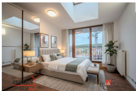
Byt 2+kk, Praha