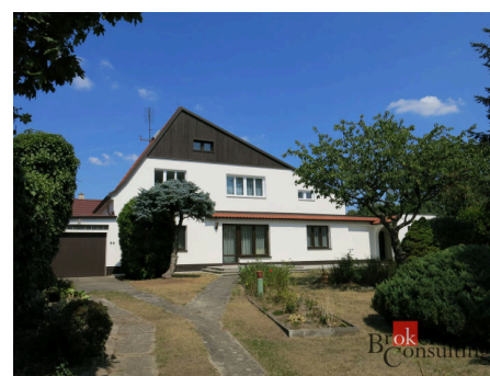
Rodinný dům, Praha