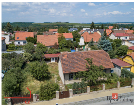
Rodinný dům, Praha